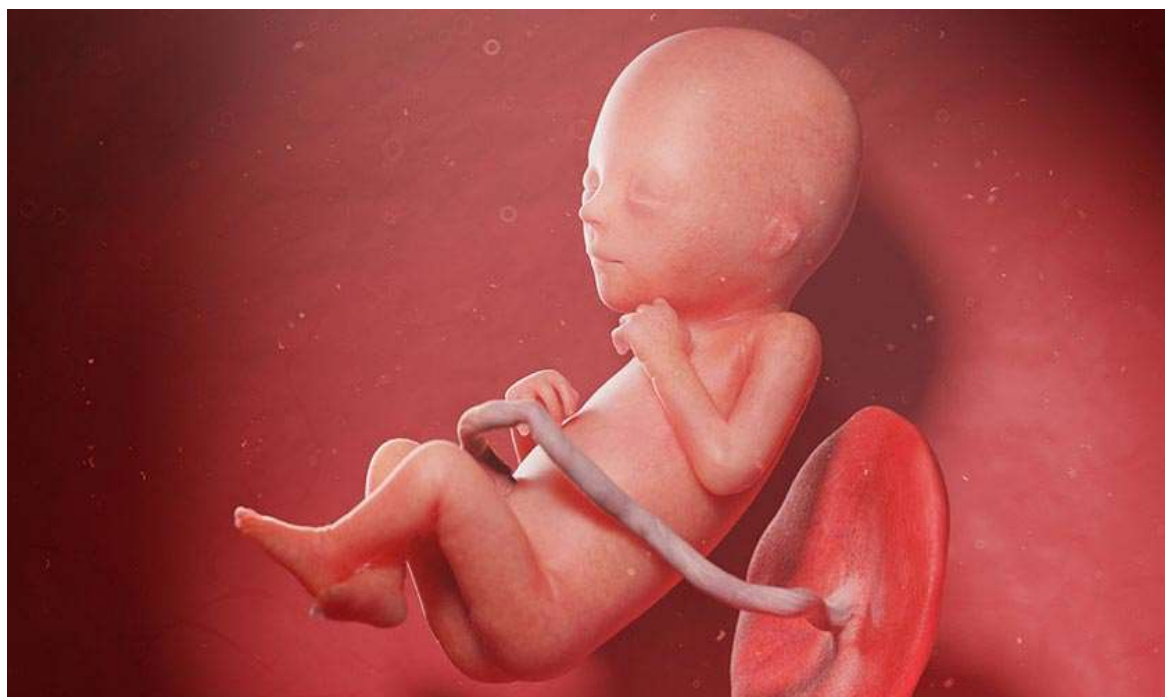
Рисунок 19. В его клетках кипит работа — продолжают развиваться структуры мозга, вырабатываются ферменты и гормоны

Малыш интенсивно тренирует желудочно-кишечный тракт и выделительную систему — заглатывает до 500 мл околоплодных вод в сутки. Попадая в желудочно-кишечный тракт, жидкость помогает развиваться пищеварительной системе. Дальше она фильтруется почками и выделяется в виде мочи.