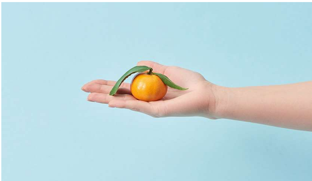
Рисунок 14. К 12-й неделе ребёнок достигает размера мандарина