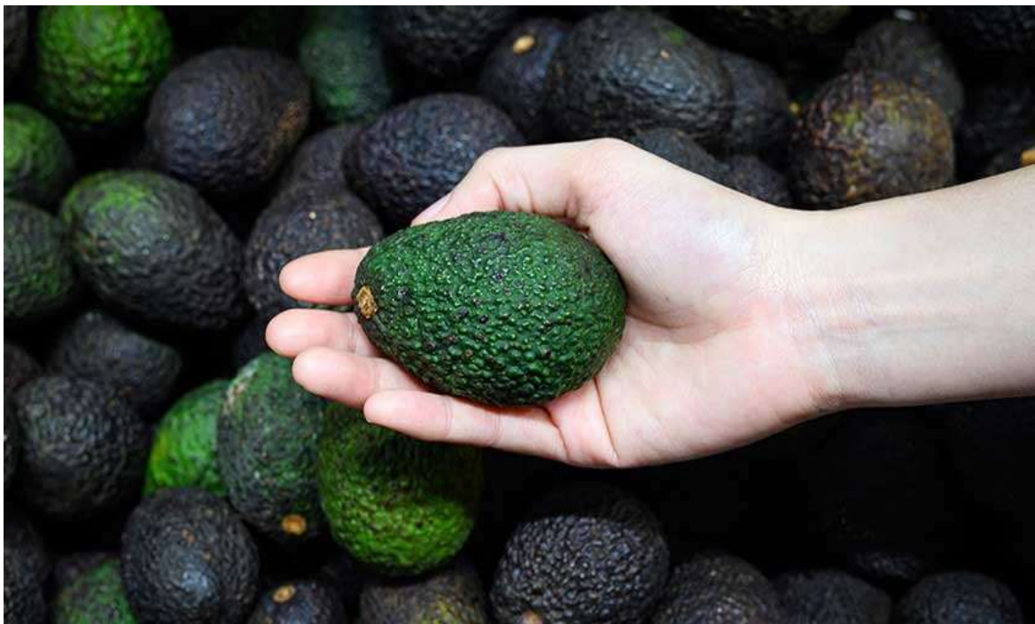
Рисунок 18. К 16-й неделе ребёнок достигает размера авокадо