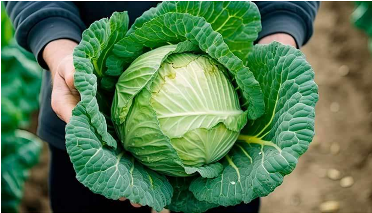
Рисунок 36. К 34-й неделе ребёнок достигает размера кочана капусты