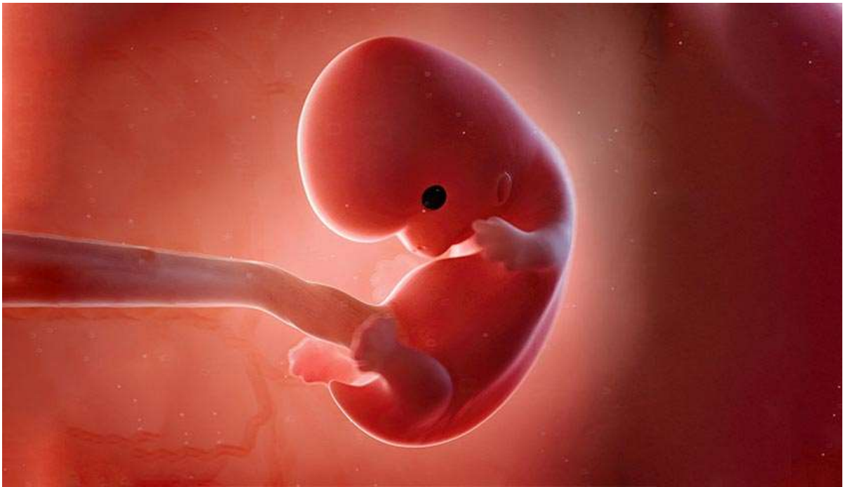
Рисунок 9. Его голова выглядит большой и непропорциональной телу из-за того, что продолжается активное развитие головного мозга