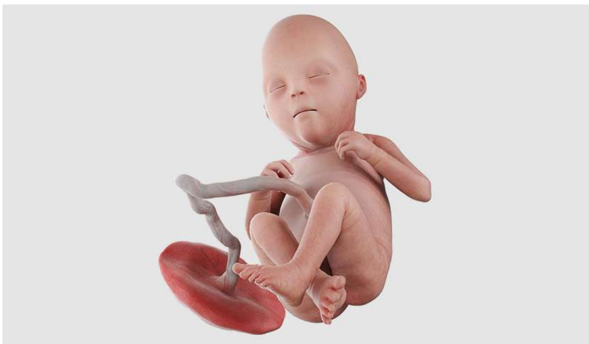
Рисунок 23. У него начинают созревать лёгкие, а в кишечнике формируется первый кал — меконий

Постепенно в работу включаются почти все органы эндокринной системы: эпифиз, гипофиз, надпочечники, поджелудочная, щитовидная и паращитовидная железа. Продолжает развиваться головной мозг, в нём уже содержится полный набор нейронов, которые позволяют мышцам сообщаться с мозгом и помогают ребёнку осознанно двигать руками и ногами.