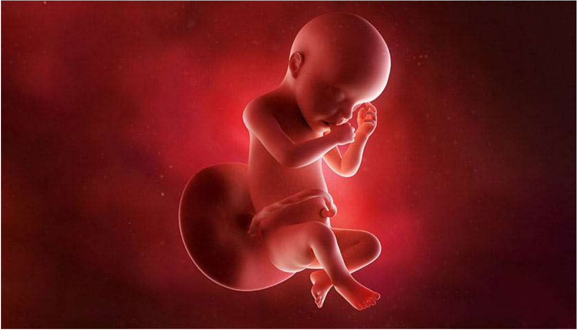
Рисунок 31. Он весит почти полтора килограмма, в головном мозге активно образуются нейронные связи