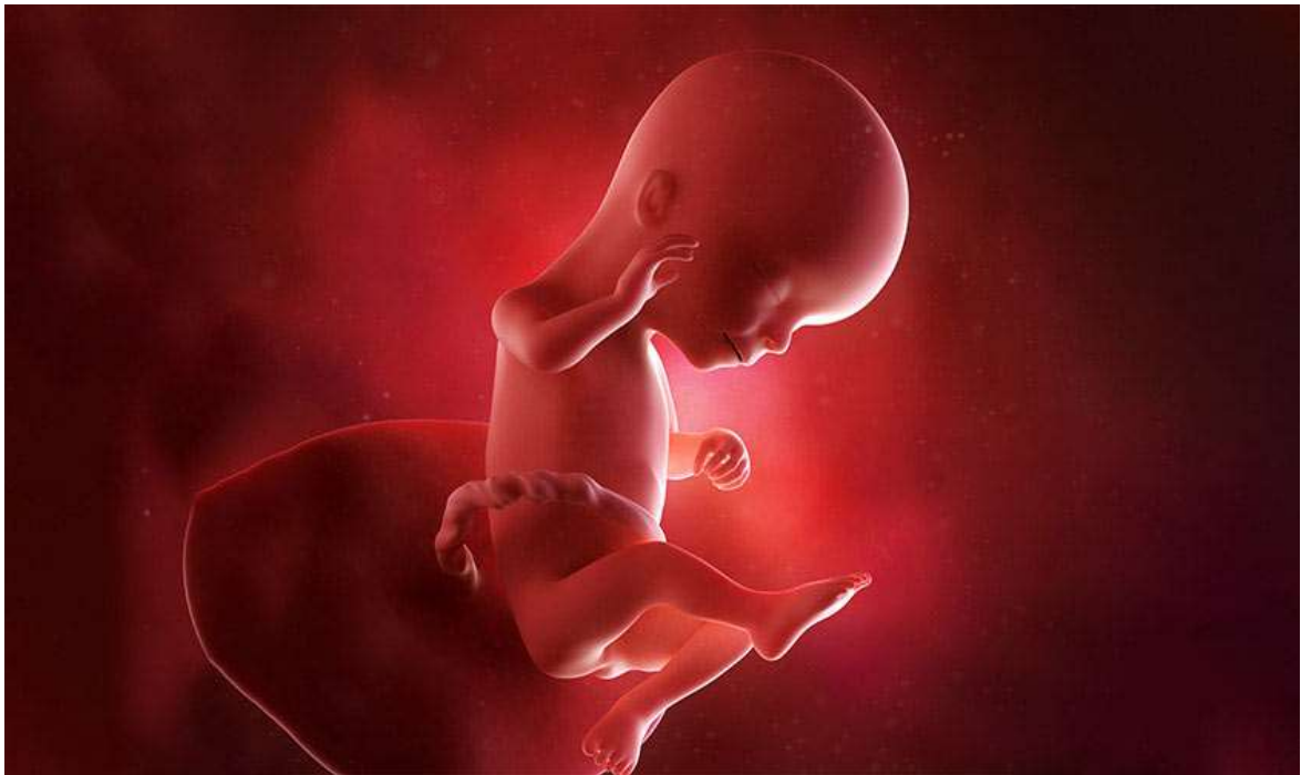
Рисунок 17. Его тело постепенно вытягивается, и голова уже не кажется настолько несоразмерной телу