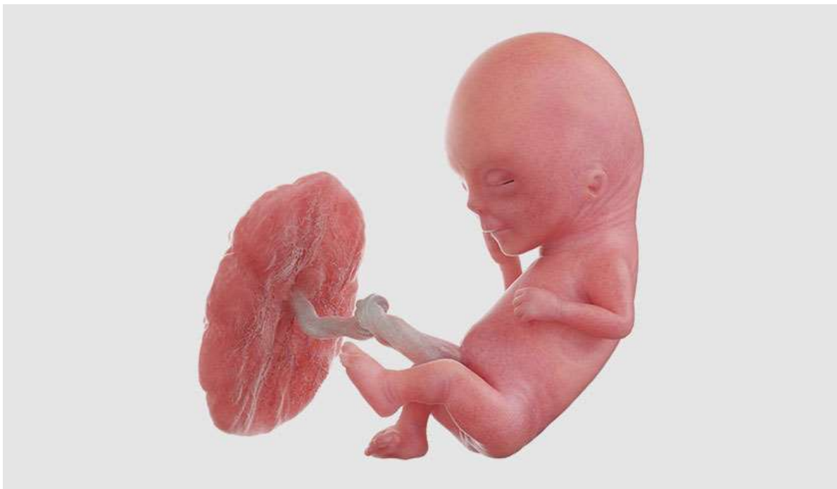
Рисунок 13. Уже можно определить его пол, а внешность приобретает уникальные черты