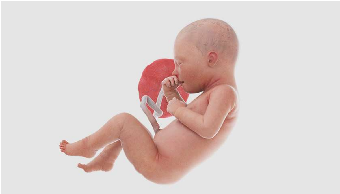
Рисунок 35. Его вес стремительно увеличивается за счёт укрепляющихся костей