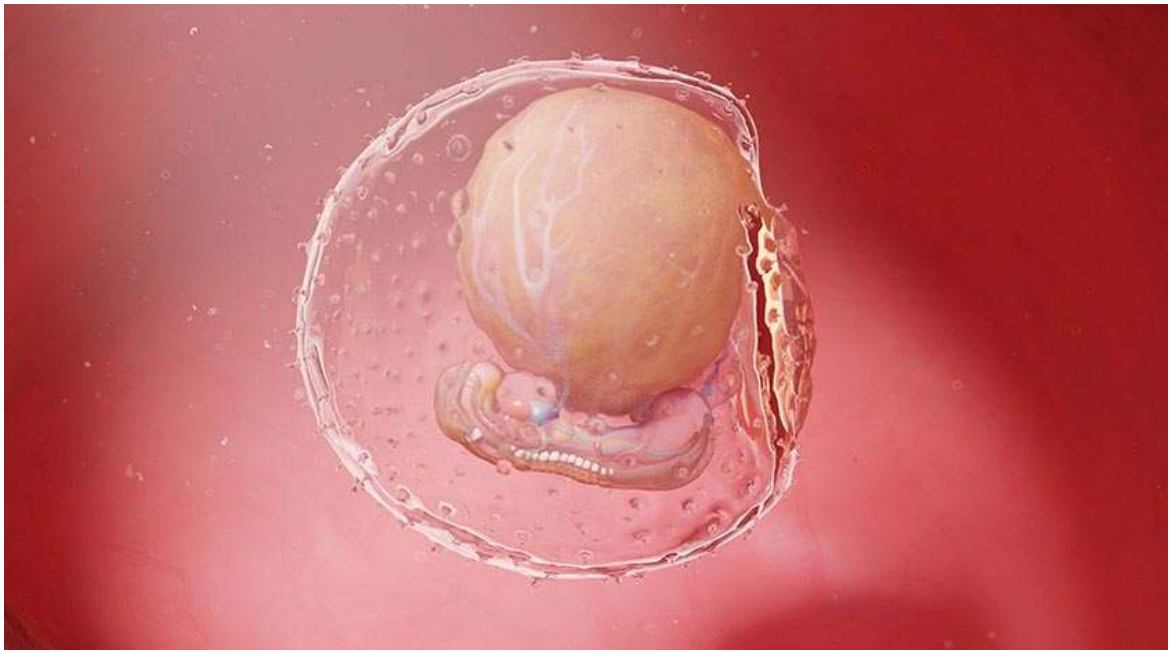
Рисунок 5. Он выглядит как скопление клеток, покрытых трёхслойной оболочкой. Со временем из слоёв формируются мозг, сердце, мышцы, кости, кожа, зубы