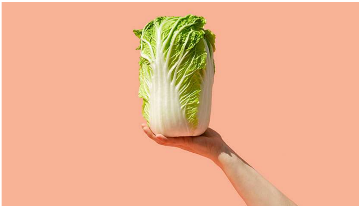
Рисунок 30. К 28-й неделе ребёнок достигает размера пекинской капусты