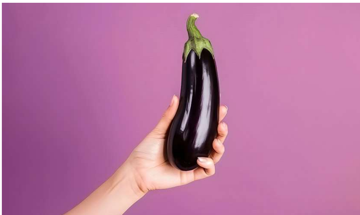
Рисунок 26. К 24-й неделе ребёнок достигает размера баклажана