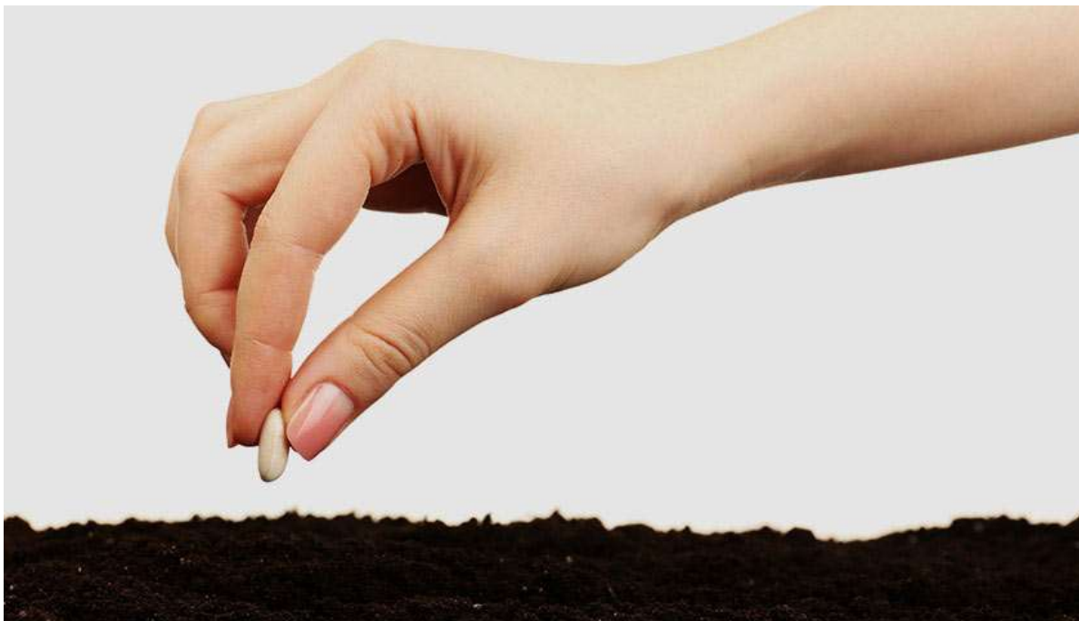
Рисунок 8. К 6-й неделе беременности эмбрион вырастает до размера фасоли