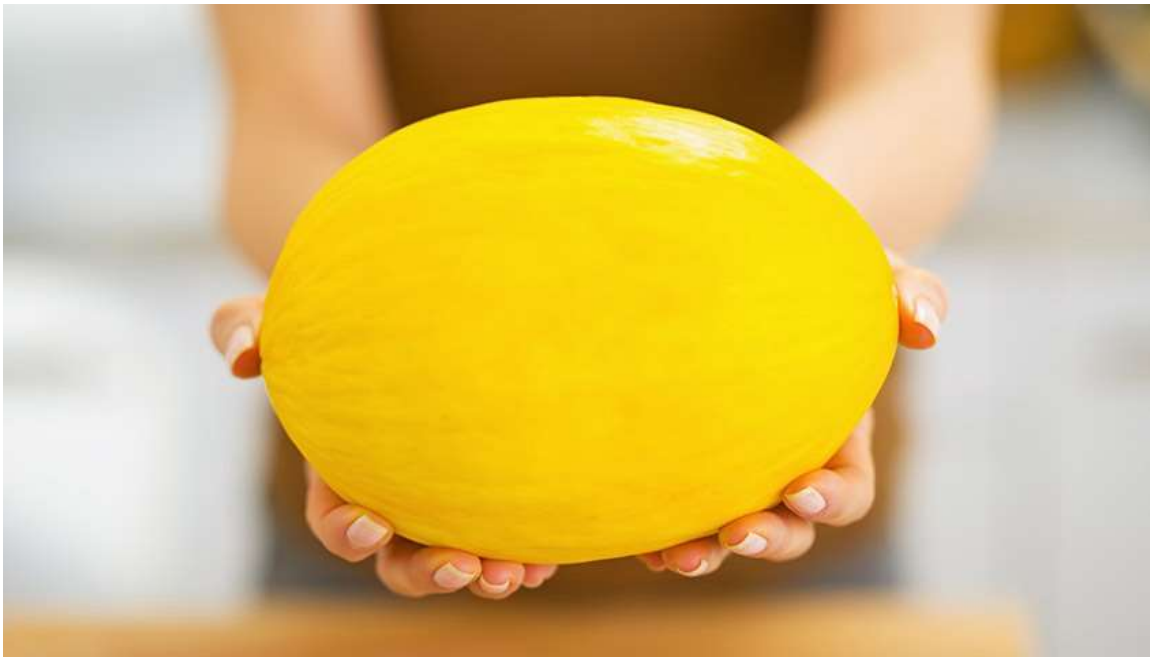
Рисунок 32. К 30-й неделе ребёнок достигает размера небольшой дыни

С 30-й по 34-ю неделю беременная женщина обычно проходит последнее УЗИ. Оно помогает оценить размер плода, увидеть пороки развития, а также определить положение ребёнка в животе. Обычно к этому сроку он окончательно поворачивается головой вниз, но иногда впереди оказываются ягодицы. Очень редко плод ложится боком.