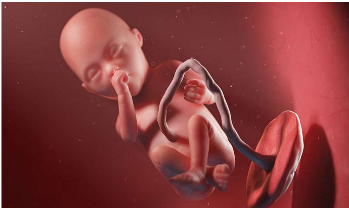
Рисунок 21. Он уже умеет моргать и может сосать большой палец, чтобы удовлетворить сосательный рефлекс

глаза, моргать. На этом сроке у плода уже выделяется ведущая рука — он становится правшой или левшой.