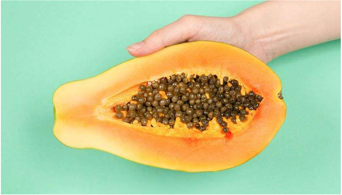
Рисунок 28. К 26-й неделе ребёнок достигает размера папайи