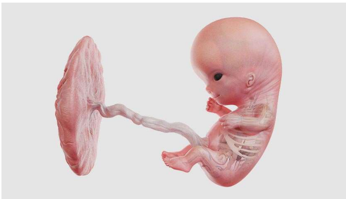
Рисунок 11. На его лице уже видны губы, нос, веки, а на бровях и голове начинают расти первые пушковые волосы

У младенца всё ещё крупная голова, в ней активно развивается мозг, уже разделившийся на два полушария. Выделяется шея, и ребёнок теперь может поворачивать голову. Кроме сжимания кулаков, он уже умеет взмахивать руками и ногами, однако делает это не намеренно, а рефлекторно. Между пальцами исчезает перепонка, ранее родившая его с амфибиями.