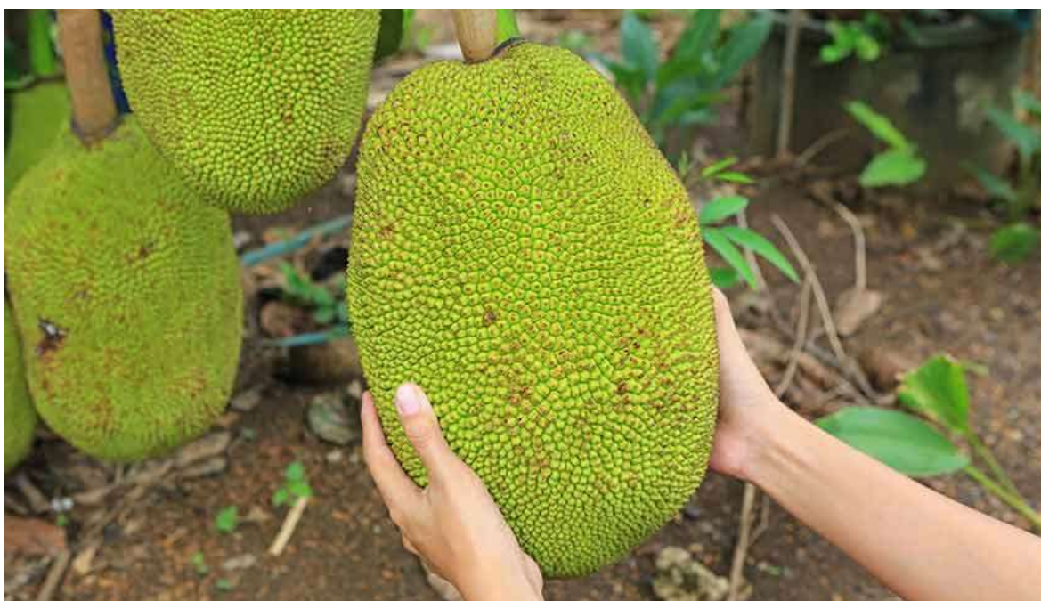
Рисунок 37. К 36-й неделе ребёнок достигает размера джекфрута

Как правило, к концу 36-й недели ребёнок окончательно определился со своим положением в матке и не изменит его до родов. В идеале он переворачивается головой вниз в так называемое головное предлежание.