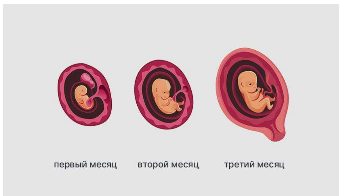
Рисунок 2. В I триместре оплодотворённая яйцеклетка превращается в 5–6-сантиметрового человечка со всеми органами, руками и ногами

Первые восемь недель беременности ребёнка в утробе матери называют эмбрионом, после — плодом.