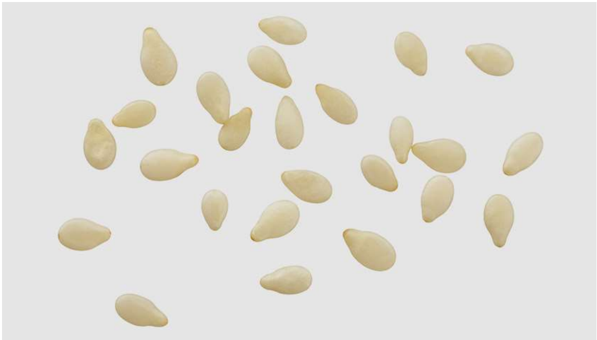
Рисунок 6. Эмбрион на 4-й неделе беременности не больше кунжутного семечка