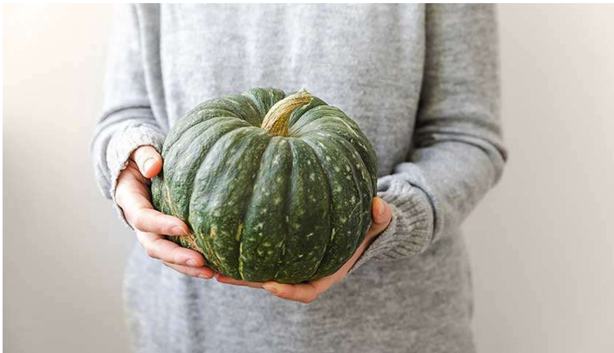
Рисунок 34. К 32-й неделе ребёнок достигает размера средней тыквы