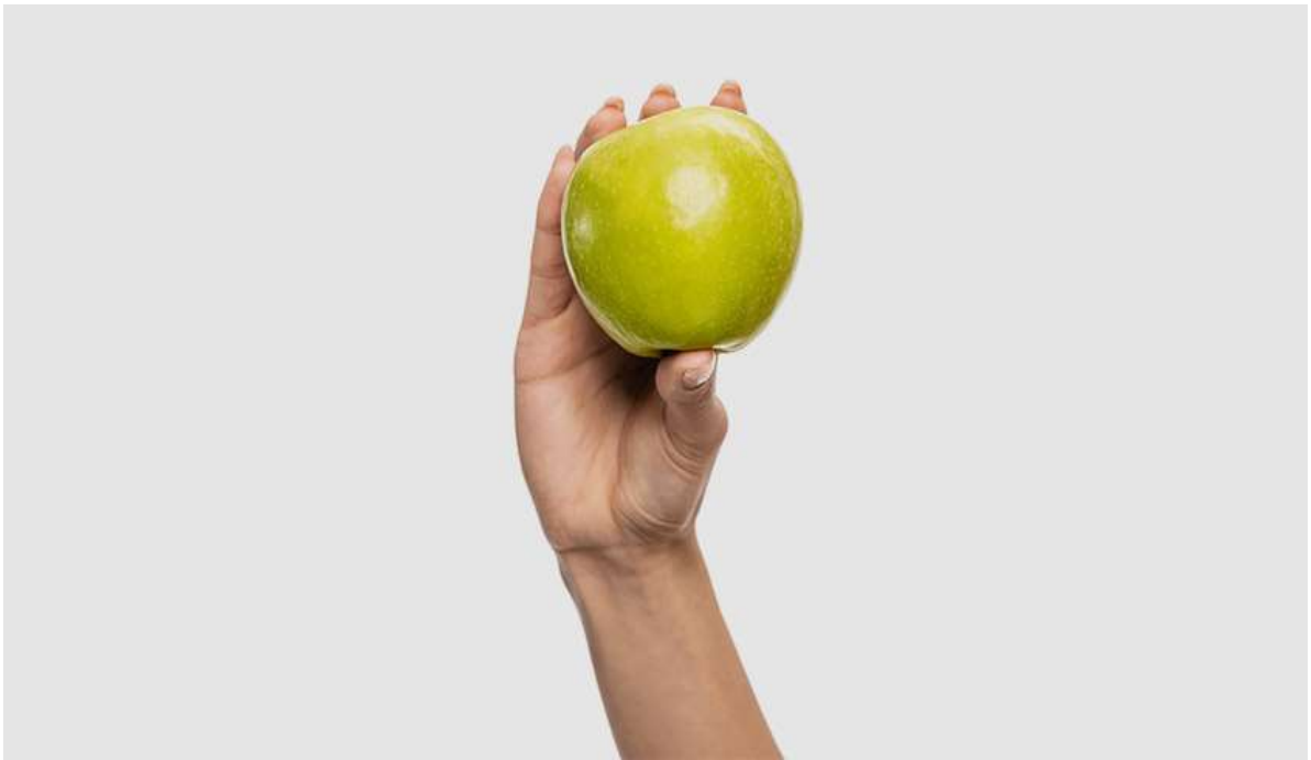
Рисунок 16. К 14-й неделе ребёнок достигает размера яблока