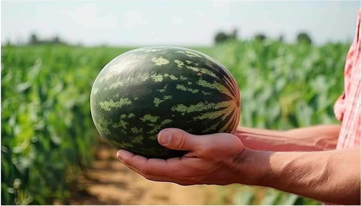
Рисунок 39. К 38-й неделе ребёнок достигает размера арбуза