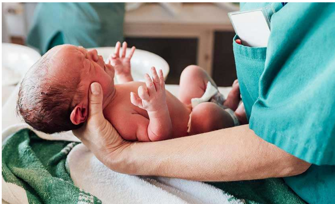
Рисунок 41. Большинство детей рождаются именно на 40-й неделе беременности, хотя задержка ещё на две также считается нормой

Адреналин также помогает матери подготовиться к родовой деятельности. Под его воздействием усиливается выработка окситоцина и быстрее раскрывается шейка матки.