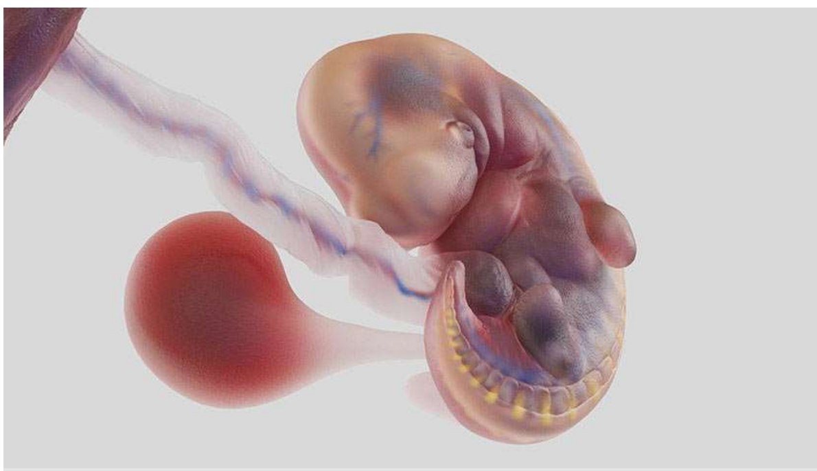
Рисунок 7. Он похож на головастика и уже имеет собственную кровеносную систему. На тельце видны зачатки рук и ног

На 6-й неделе беременности у эмбриона заметно выделяется «хвост», поэтому малыша сравнивают с головастиком. У него появляются зачатки конечностей — бугры на месте будущих рук и ног, закладываются лицевые структуры: тёмными точками выделяются будущие глаза, ямочками — уши. Внутренние органы продолжают формироваться, а сердце уже бешено стучит: частота сердечных сокращений (ЧСС) зародыша на этом сроке беременности достигает 160 ударов в минуту. Это в два раза быстрее, чем у взрослого.