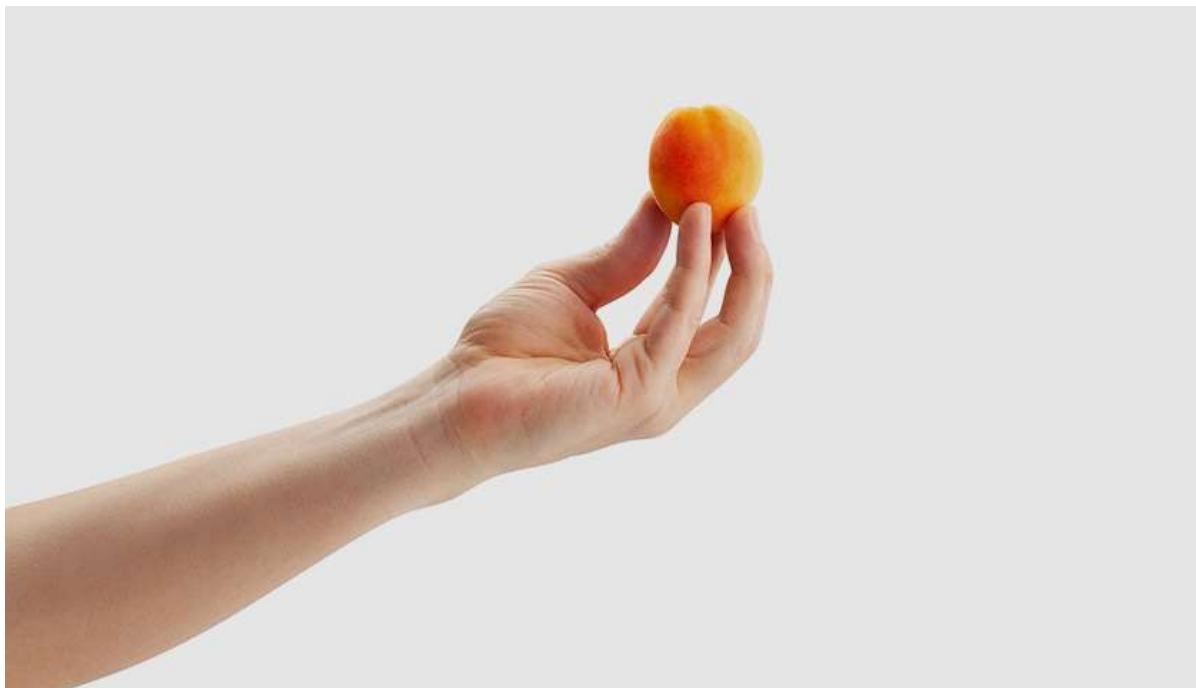
Рисунок 12. К 10-й неделе плод достигает размера абрикоса