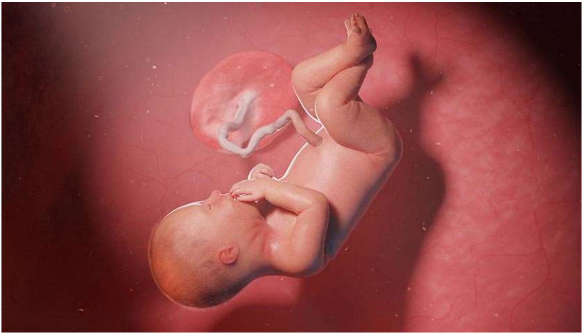
Рисунок 38. Обычно он занимает положение «головой вниз», которое уже не изменится до родов