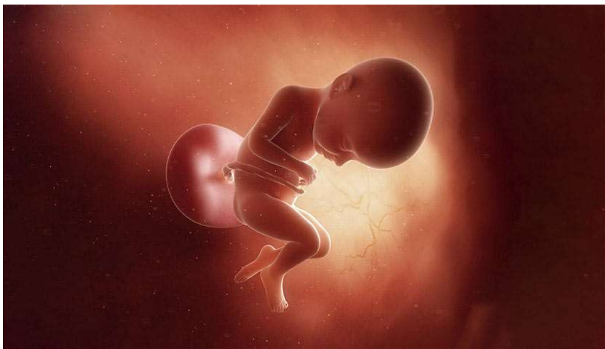
Рисунок 33. Он уже хорошо слышит. К большинству звуков малыши привык, и они его не пугают

Органы продолжают совершенствоваться: функционируют лёгкие, железы внутренней секреции, подключается иммунная система. Почти сформировано сердце.