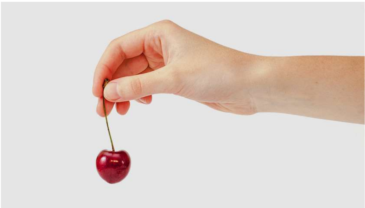
Рисунок 10. К 8-й неделе беременности плод достигает размера вишни

Дефицит йода в организме матери на этом сроке может негативно повлиять на развитие ребёнка. Дело в том, что этот микроэлемент нужен для формирования костной и хрящевой ткани, а также нервной и гормональной системы.