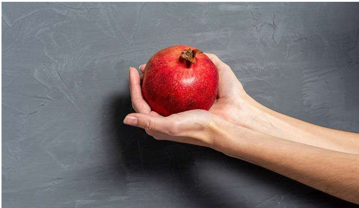
Рисунок 20. К 18-й неделе ребёнок достигает размера граната