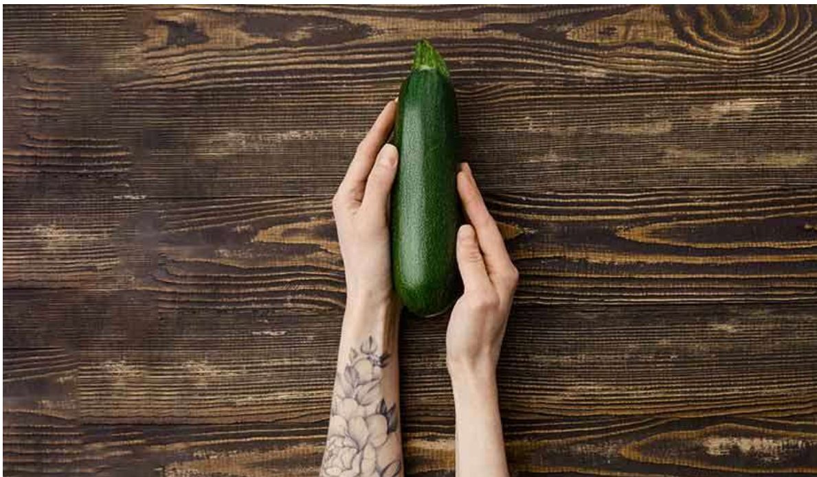
Рисунок 24. К 22-й неделе ребёнок достигает размера цукини

Если младенец родится на этом сроке, у врачей есть шанс выводить его. О начале преждевременных родов могут говорить обильные водянистые выделения, кровотечение из влагалища и сильные болезненные спазмы в животе и пояснице.