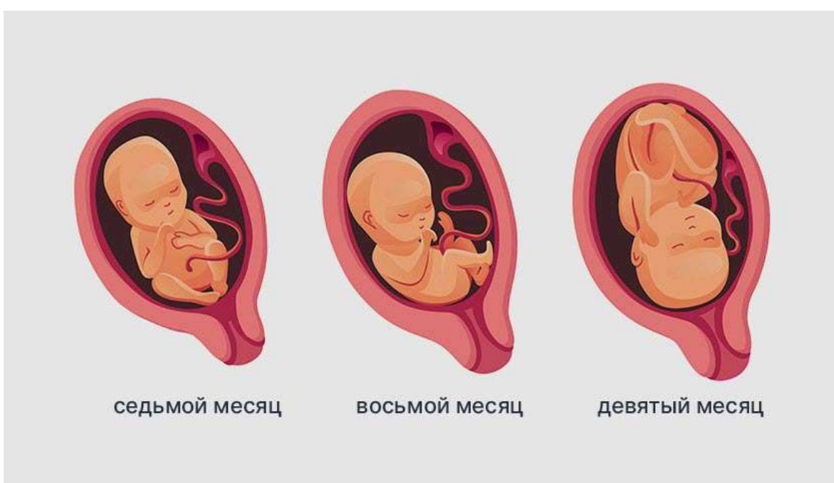
Рисунок 4. В III триместре ребёнок активно набирает вес и готовится к встрече с родителями

Метаморфозы происходят ежедневно, поэтому с каждой новой неделей ребёнок всё больше изменяется.