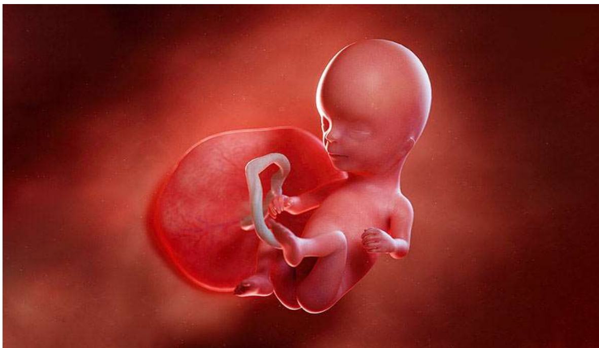
Рисунок 15. У него появилась неосознанная улыбка и уникальные отпечатки пальцев

На этом сроке беременности все малыши блондины, потому что у них ещё нет окрашивающего волосы пигмента.