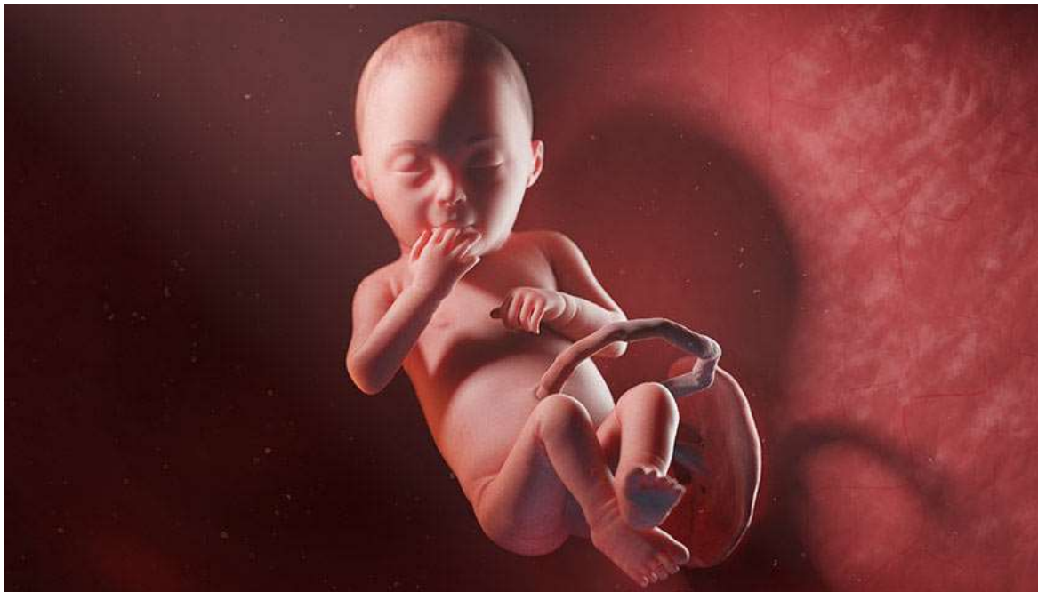
Рисунок 29. Кожа становится гладкой, а волосы сохраняются только на голове, плечах и спине

Скелет к этому времени сформировался полностью, однако кости остаются мягкими и окончательно затвердеют уже только после рождения.