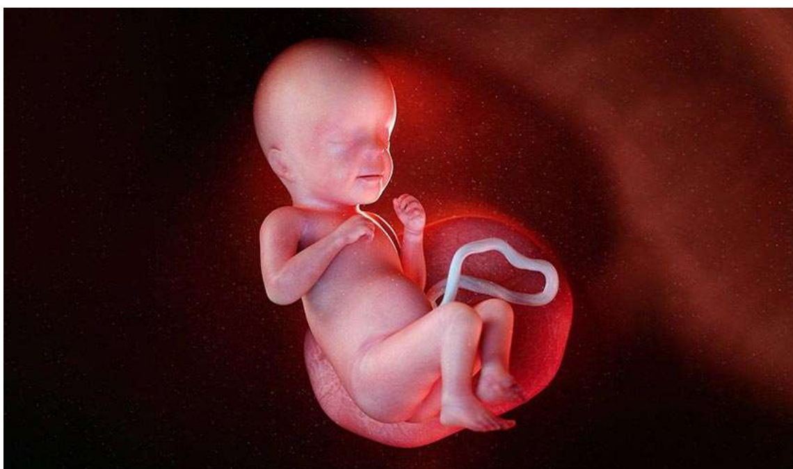
Рисунок 27. У него уже полностью сформированы глаза, лёгкие занимают своё постоянное место в грудной клетке

У него полностью сформированы пищеварительная система, головной мозг и все органы чувств. В лёгких становится больше клеток, вырабатывающих сурфактант, благодаря которому расправляются воздушные пузырьки — альвеолы.