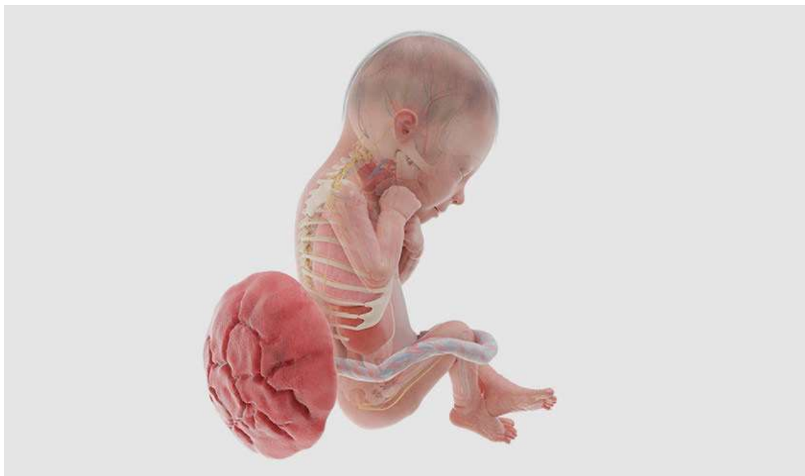
Рисунок 25. У него сформированы практически все внутренние органы и системы, активно развиваются лёгкие

Малыш уже не так активно двигается, теперь он дольше остаётся в определённом положении, которое в конце II триместра может стать постоянным.