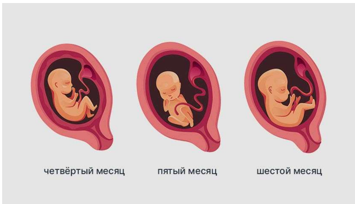
Рисунок 3. Во II триместре плод растёт, а органы и системы организма настраиваются на самостоятельную работу