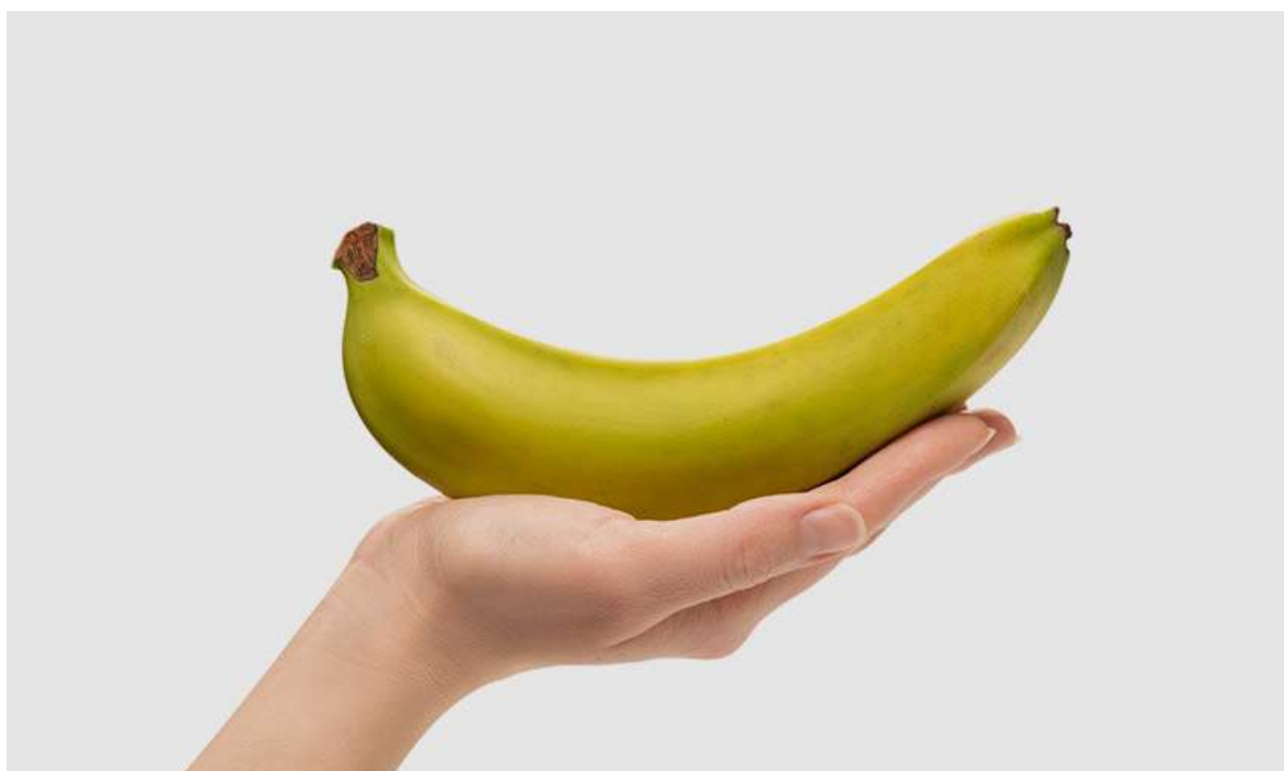
Рисунок 22. К 20-й неделе ребёнок достигает размера банана

На 20-ю неделю беременности врач обычно назначает ультразвуковое исследование, во время которого будущие родители могут лучше разглядеть своего малыша и узнать его пол.