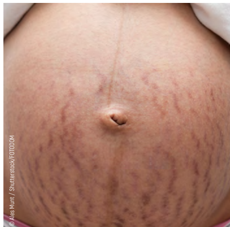
Рис. 2. Стрии (растяжки).