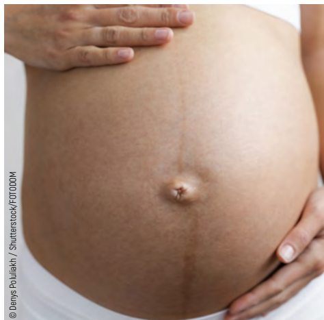
Рис. 1. Гиперпигментация белой линии живота.

Лайфхак! Снизить вероятность появления изменений кожи помогут масла и увлажняющие кремы для повышения упругости кожи, контрастный душ, массаж с помощью жёсткой щётки.